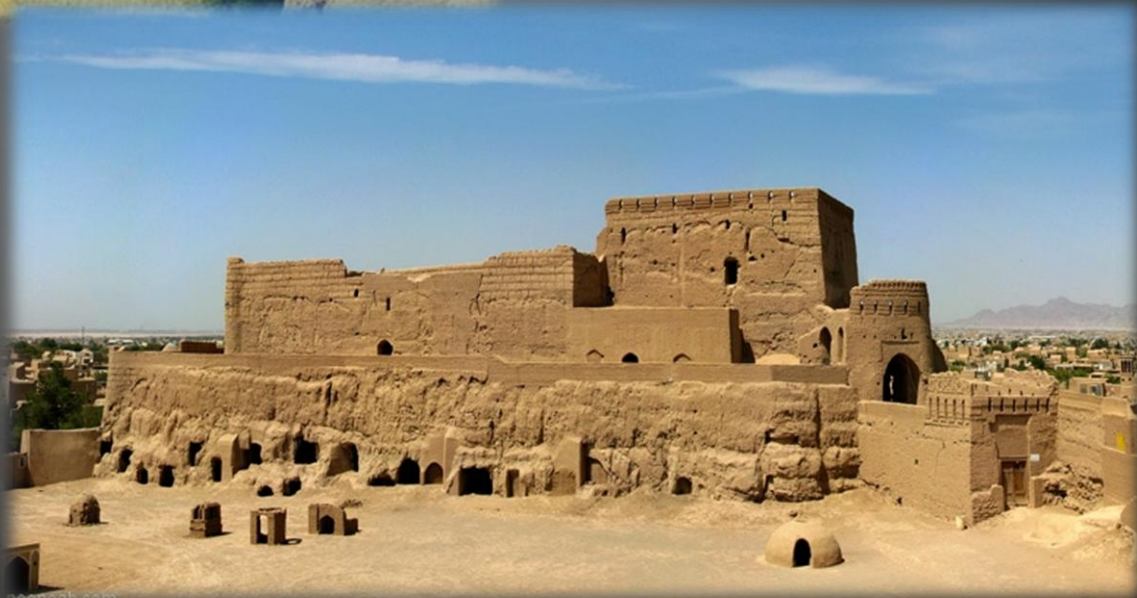
اشکانیان - مهران خواجه