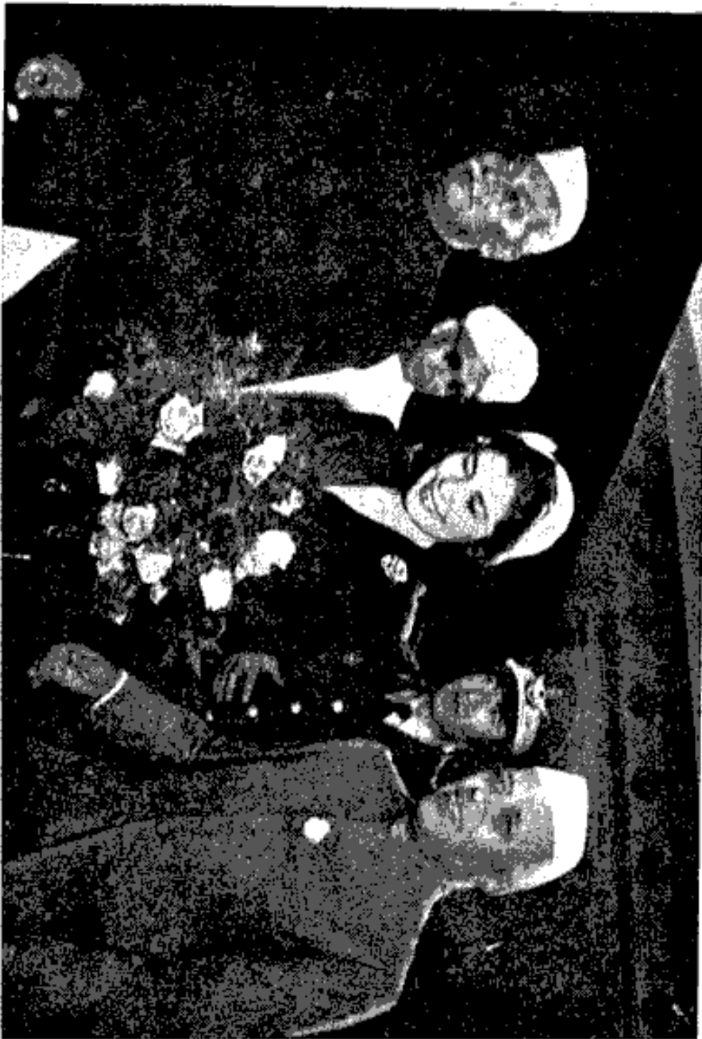
شاهنشاه و علیاحضرت ملکه تریا در فرودگاه دهلی نو

۵۰ بنا برد عوت حضرت رئیس جمهور هند (دکتر راجندر پراساد) اعلیحضرت هما یونی و علیاحضرت ملکه تریا در زمستان ۱۳۳۴ شمسی مسافرتی به هندوستان فرموده اند. برنامه سفر (۲۴ بهمن - ۱۴ اسفند) شامل بوده است بر ورود شاهنشاه به دهلی نو و بازدید از شهرهای: نتکال، دهرادون، آگره، علیگر، لکنو، بنارس، حیدرآباد، بنگالور، میسور، پونه و بمبئی.