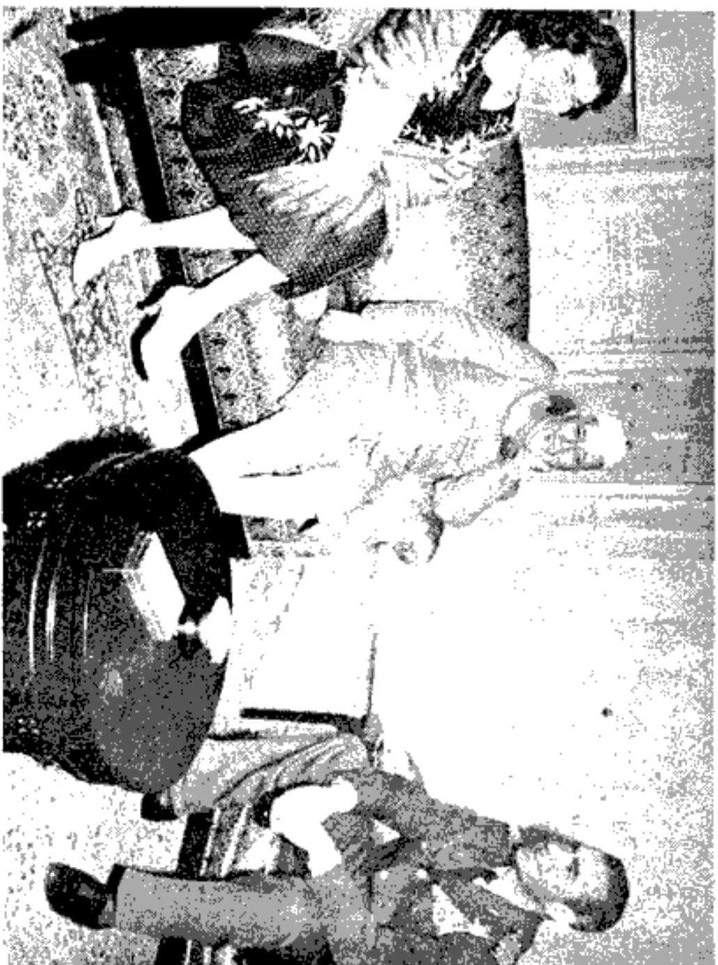
این عکس در روز دوم ورود شاهزاده به هند در دهلی نو برداشته شده است