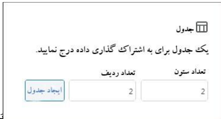
تعداد ردیف و ستون

در مرحله بعد، از شما خواسته می‌شود تعداد سطر و ستون مورد نظر را برای جدول خود انتخاب کنید. به طور پیش فرض تعداد سطر و ستون بر روی ۲ تنظیم شده است و بنابر نیاز خود می‌توانید آن را تغییر دهید، در صورتی که از تعداد دقیق آن مطمئن نیستید بعد از ایجاد جدول نیز می‌توانید تعداد سطر و ستون‌ها را ویرایش نمایید.