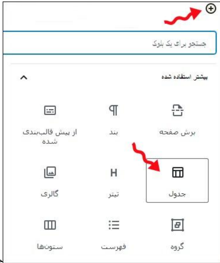
جدول در ویرایشگر وردپرس

در مرحله بعد، از شما خواسته می‌شود تعداد سطر و ستون مورد نظر را برای جدول خود انتخاب کنید. به طور پیش فرض تعداد سطر و ستون بر روی ۲ تنظیم شده است و بنابر نیاز خود می‌توانید آن را تغییر دهید، در صورتی که از تعداد دقیق آن مطمئن نیستید بعد از ایجاد جدول نیز می‌توانید تعداد سطر و ستون‌ها را ویرایش نمایید.