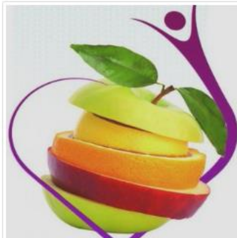
کانال گلستان سلامت

دانستنی های جالب و علمی در حوزه سلامت و زیبایی