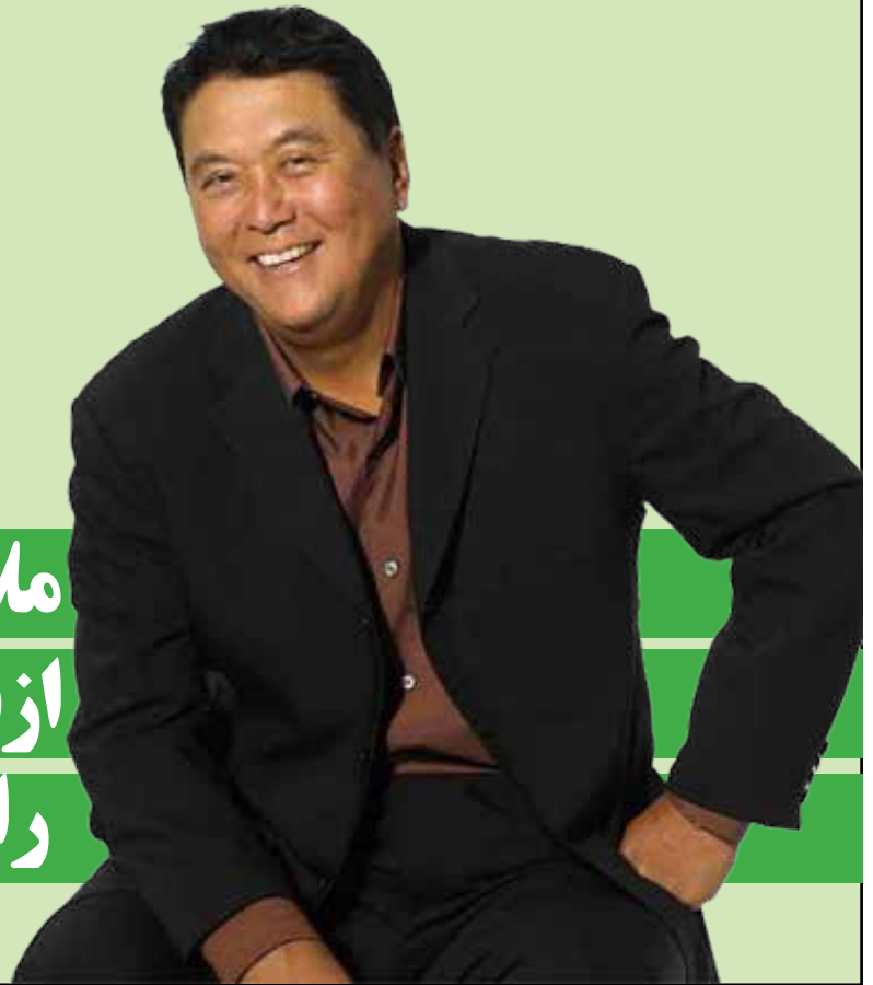
مدیر کلینیک توسعه فردی ستکا